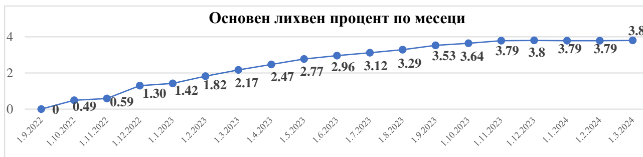
Основен лихвен процент по месеци

Източници: Национален статистически институт, Министерство на финансите, Българска народна банка